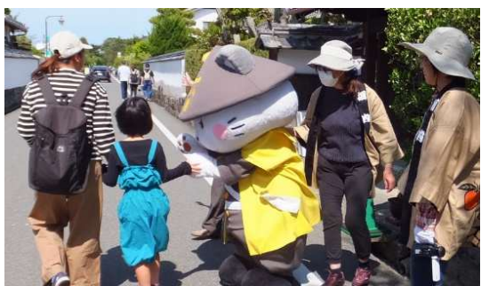
大人気だった「萩にゃん」：中には、萩にゃんに会いに引き返してくる子供たちの姿もありました

5月3日(水)、新型コロナも一段落し好天に恵まれたゴールデンウィークとあって、今年の堀内散策には、昨年より約100人増の464人の参加者が県内外からありました。